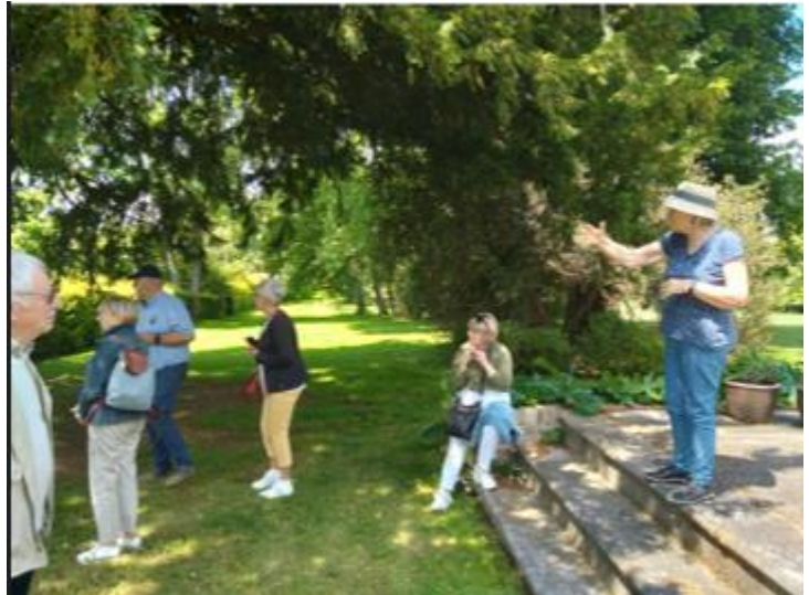
Accueil par la propriétaire du château de Creuse