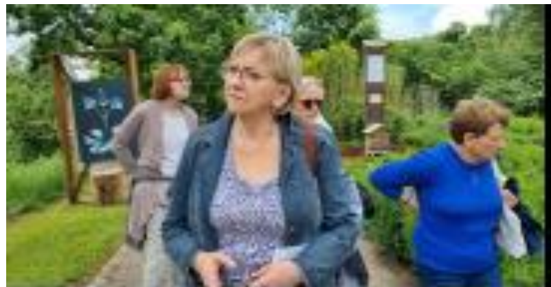
Photo de groupe sur le pont des Australiens