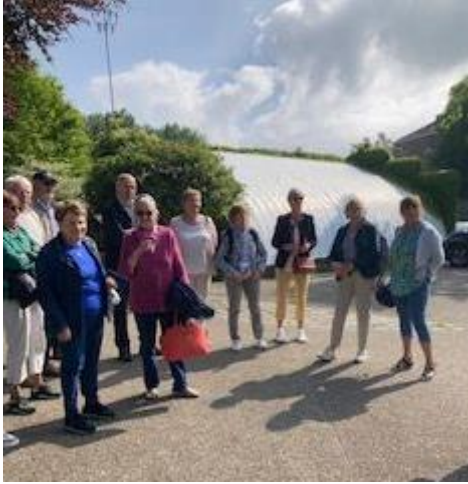
b Accueil au jardin des plantes d'Amiens par notre guide

Et il faut le préciser sous le soleil !!!