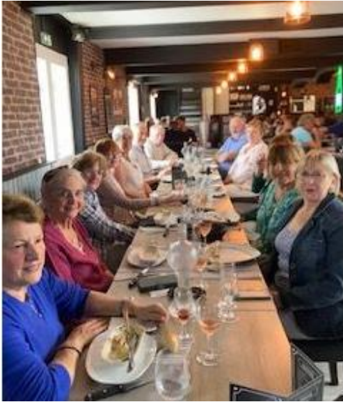
Après l'effort le réconfort au bistrot des saveurs de Fluy